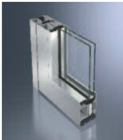
Schüco ADS 75 HD.II Schüco ADS 75 HD.II

With its elegant flush cover plates and invisible hinges, the ADS 75 HD.II is now available in a new version up to 3 m design.