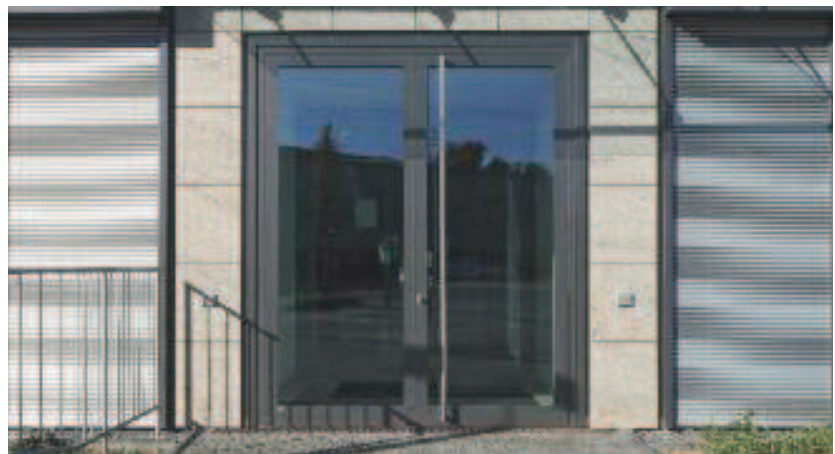
Schüco Porte ADS 75 HD.II Schüco Door ADS 75 HD.II